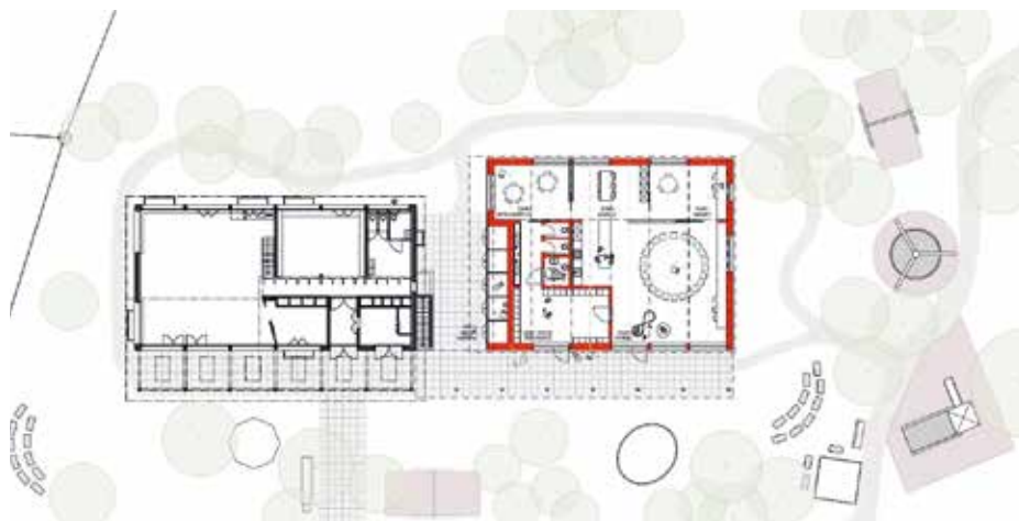
Neubau Kindergarten Grundriss Erdgeschoss

Mit dem Neubau eines Kindergartens in unmittelbarer Nachbarschaft des bereits bestehenden Kindergartens werden einerseits betriebliche Synergien geschaffen und andererseits kann der attraktive Aussenraum gemeinsam genutzt werden. Es entsteht eine zentrale Kindergartenstruktur. Die identitätsstiftenden Orte der einzelnen Zonen auf dem Areal werden gestärkt, ohne dass klare Grenzen gezogen werden müssen. Verbindende Elemente wie der Spielplatz bleiben erhalten und öffentlich zugänglich.