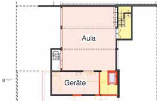
Turnhallentrakt Grundriss 2. Untergeschoss