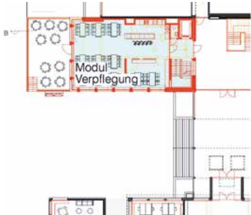
Tagesschule Grundriss Erdgeschoss