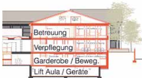
Tagesschule Grundriss Querschnitt