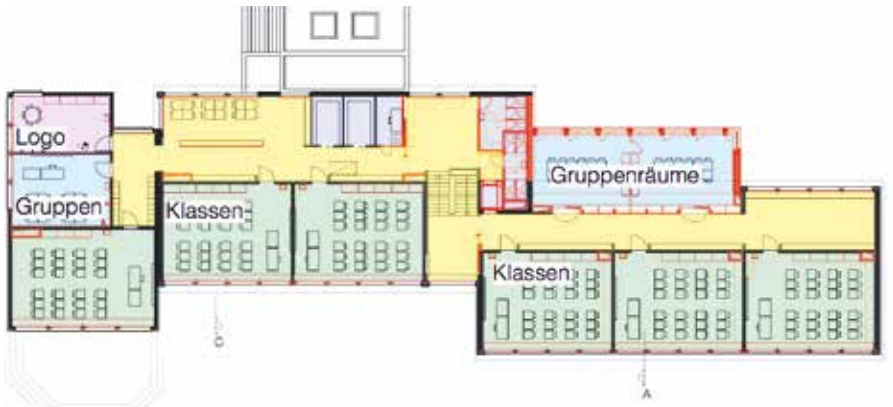
Klassenstrakt Grundriss Obergeschoss