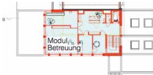
Tagesschule Grundriss Obergeschoss