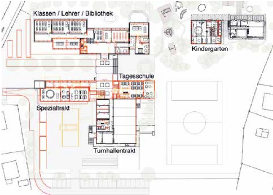
Gesamtsituation Schulanlage Stämpbach