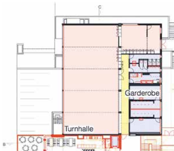
Turnhallentrakt Grundriss Erdgeschoss