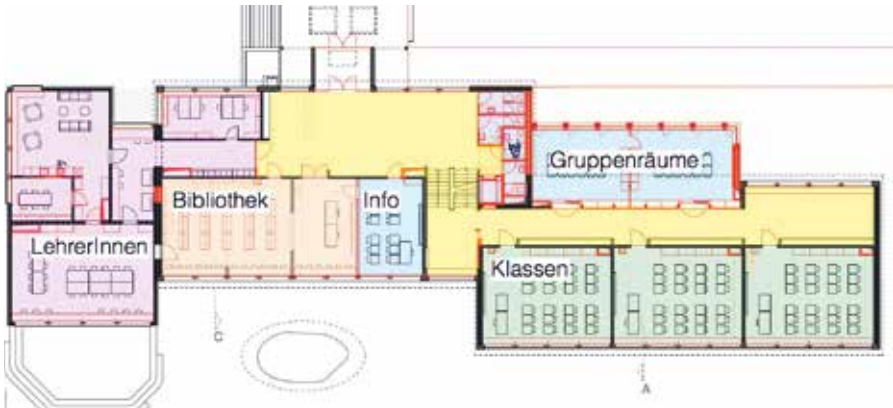
Klassenstrakt Grundriss Erdgeschoss